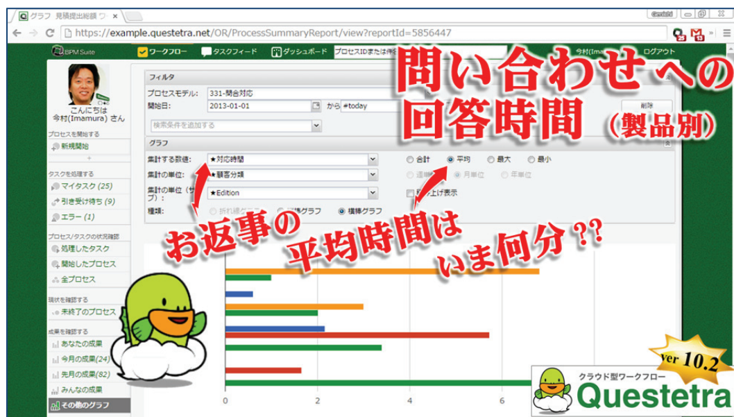
<フィルタリング・チャート(グラフ集計機能)、平均時間分析の例>

Ver. 10.2 リリースノート: http://www.questetra.com/ja/info/version-1020/