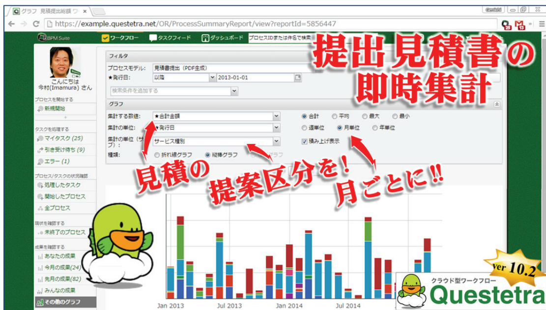
<フィルタリング・チャート(グラフ集計機能)、総額集計の例>

サンプル画像⇒ http://www.questetra.com/ja/info/performance-monitoring-20150420/