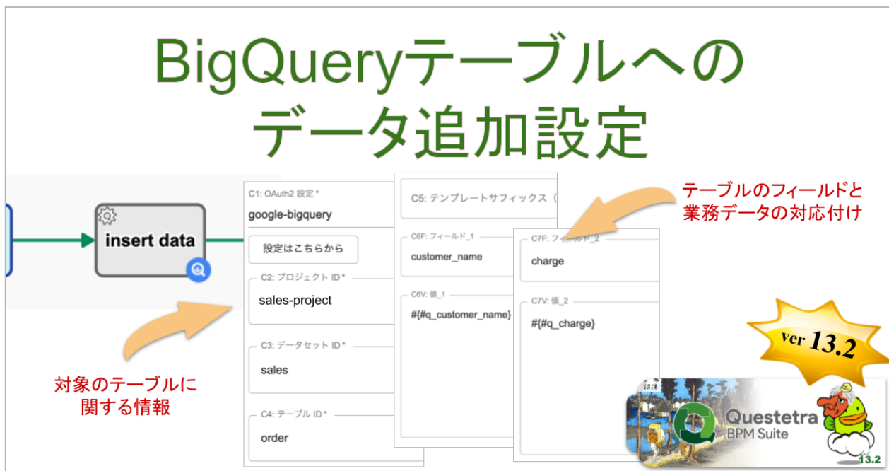
<Google BigQuery テーブルへのデータ追加設定>

サービス工程を利用して、Google BigQuery のテーブルにデータを自動追加できるようになります。これにより、例えば、受注承認後すぐに(リアルタイムで)受注データが BigQuery に追加される、というような仕組みを構築できるようになります。また、業務データを手動でテーブルに追加するという手間が削減されます。(Google BigQueryのご利用には別途費用がかかります)※対象エディション: Advanced, Professional