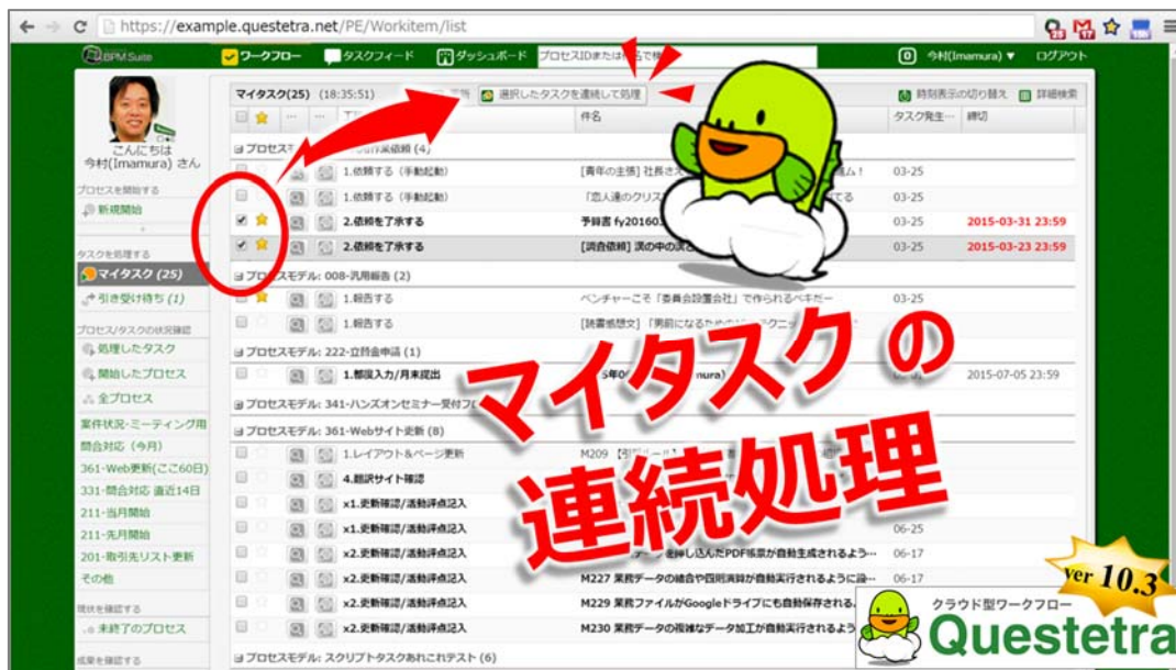
<マイタスク連続処理機能>

Ver. 10.3 リリースノート: http://www.questetra.com/ja/info/version-1030/