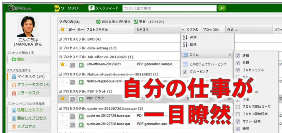
<マイタスクの一覧画面>

等の機能で構成されます。業務フローの処理実態にあわせて、業務の流れ(業務プロセス)を積極的にカイゼンし続ける事が可能なワークフローです。サーバ知識やプログラミング知識は要りません。無料版には 5 人までのユーザ数制限があります。