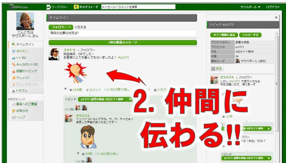
<「社内 SNS 機能」のタイムライン画面>

今回の新バージョン 9.4 では、この「社内 SNS 機能」において、感情を簡単に伝えることができる「スタンプ」が利用できるようになりました。例えば、納品物が無事検収された際などに、プロジェクトメンバーは自分の感情を積極的に発信することが可能です。「スタンプ」は、従来の社内メールや報告書では困難だった「感情」の共有を促進します。