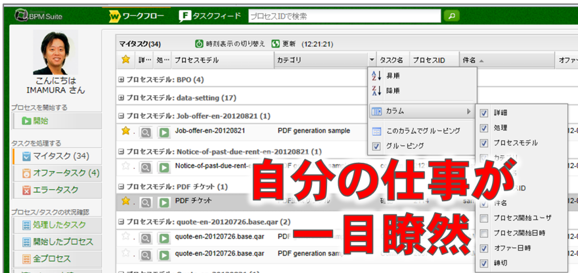
<「タスク処理機能」のタスク一覧画面>

※無料アカウントの申込: http://www.questetra.com/ja/trial/